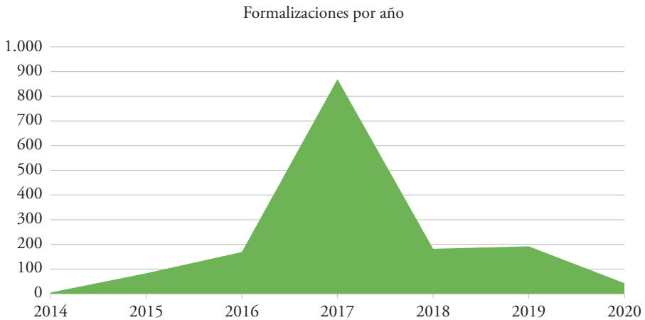
Figura 1 Número de registros formalizados por año (1.6.2020)

Si estuviéramos frente a un proceso de formalización exitoso, podríamos ver una curva ascendente, y si la curva descendiera, sería porque el número de mineros por formalizar habría disminuido de manera drástica. No obstante, vemos que el proceso fue exitoso en un solo momento, en el año 2017, período que coincide con la flexibilización de los requisitos para la formalización minera. Es evidente que quien deseaba formalizarse, se formalizó. Actualmente, tal como evidencia la figura 1, la tendencia es a no formalizarse.